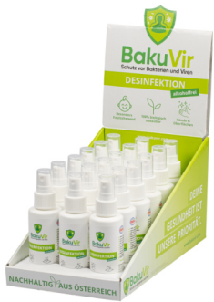
BakuVir 50ml/100ml mit Sprühkopf im Thekendisplay