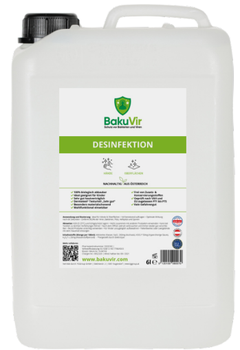
BakuVir 6L Kanister