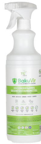
1L Flasche mit Sprühkopf