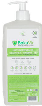
1L Euroflasche mit Pumpspender