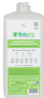
1L Euroflasche mit Schraubverschluss